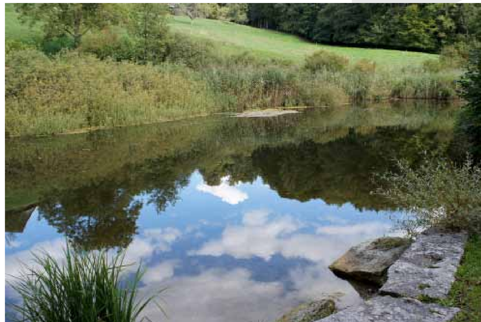
Weiher Jonen im Eigentum der Pro Natura (ehem. Schweiz. Bund für Naturschutz), Basel

Protokoll der Ortsbürgergemeindeversammlung vom 11. Mai 2015