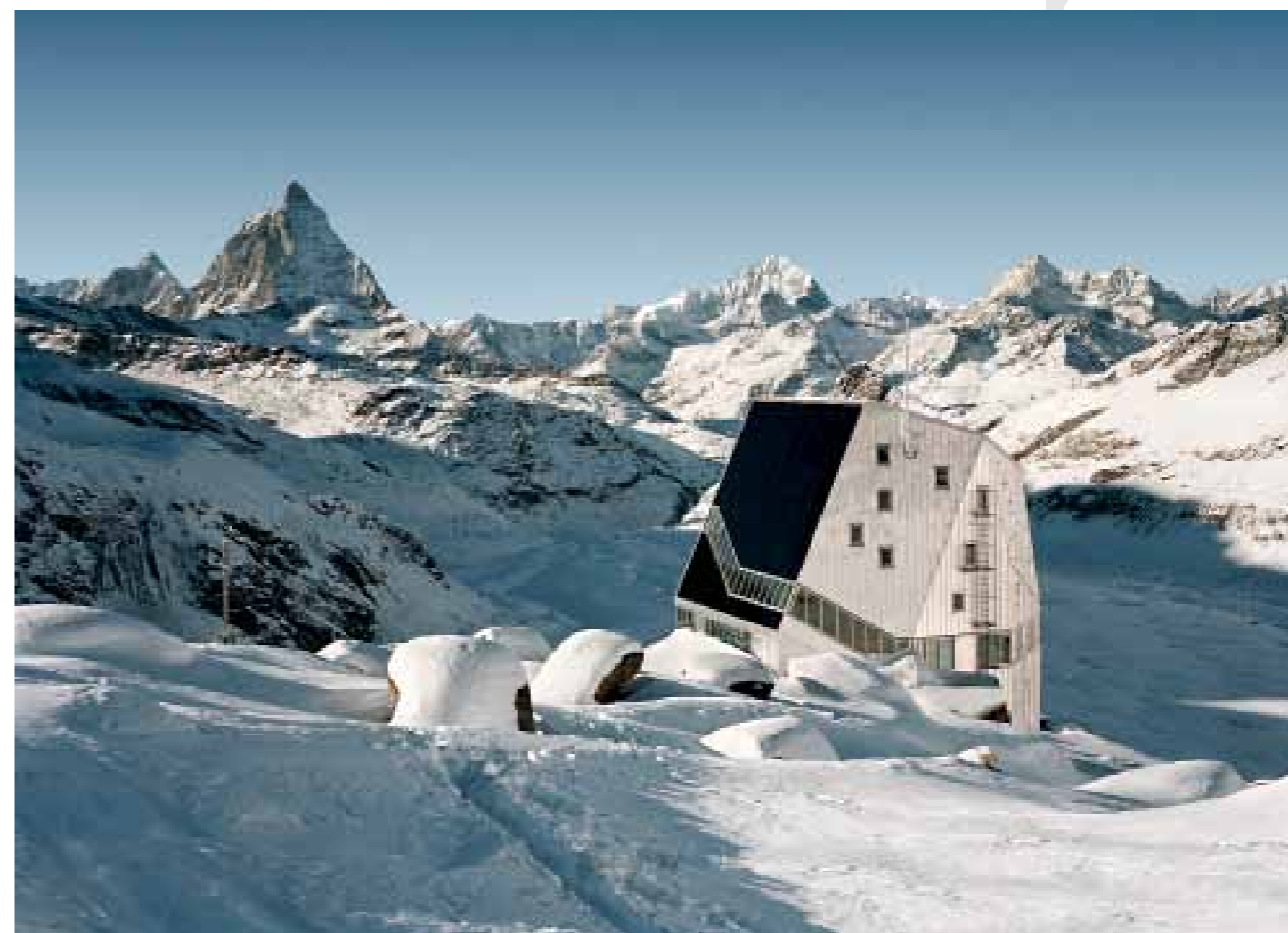
Neue Monte-Rosa-Hütte SAC, Fertigstellung 2009