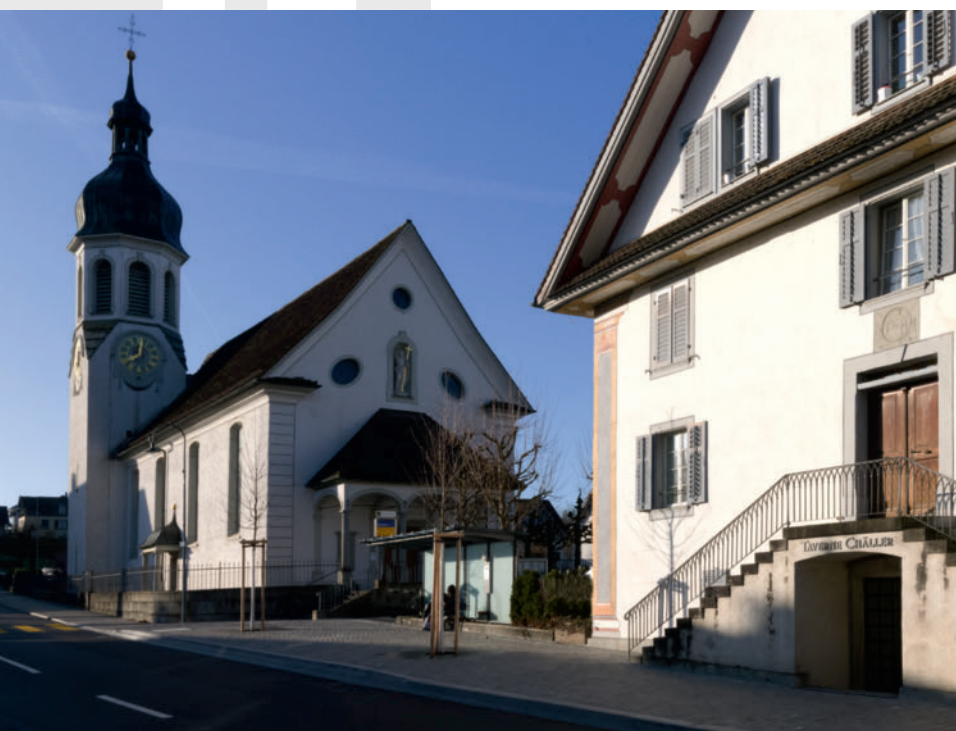
Hindernisfreie Bushaltestelle Taverne

Für die Gesamtsanierung der Mehrzweckhalle und des Gemeindehauses wurde nach der Submission der Planerleistungen im Jahr 2025 unter Einbezug der Planungskommission und der Fachplaner die Detailplanung in Angriff genommen. Das konkrete Sanierungsprojekt liegt mittlerweile vor. Nähere Informationen dazu finden Sie auf den Seiten 12-19.