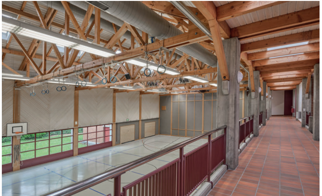
Die Mehrzweckhalle dient u.a. dem Sportunterricht der Schule, den wöchentlichen Trainings von Vereinen und kulturellen Anlässen wie Theatervorführungen, Musikkonzerten oder Fasnachtsbällen.

Da die Mehrzweckhalle regelmässig für grössere und kleinere Veranstaltungen wie Theatervorführungen, Musikkonzerte oder Schulschlussfeiern gebucht wird, soll die 44-jährige Licht- und Tontechnik auf einen modernen Stand gebracht und die Bühne inkl. der Trennwände teilerneuert werden. Die Elektroinstallationen und die Lüftungsanlage haben das Ende ihrer Laufzeit erreicht und müssen instand gestellt werden – mit positiven Auswirkungen auf das Raumklima der Halle, das bislang insbesondere im Sommer nicht optimal war. Ebenfalls soll die Gastroküche – in Absprache mit den Dorfvereinen – vollumfänglich erneuert werden.