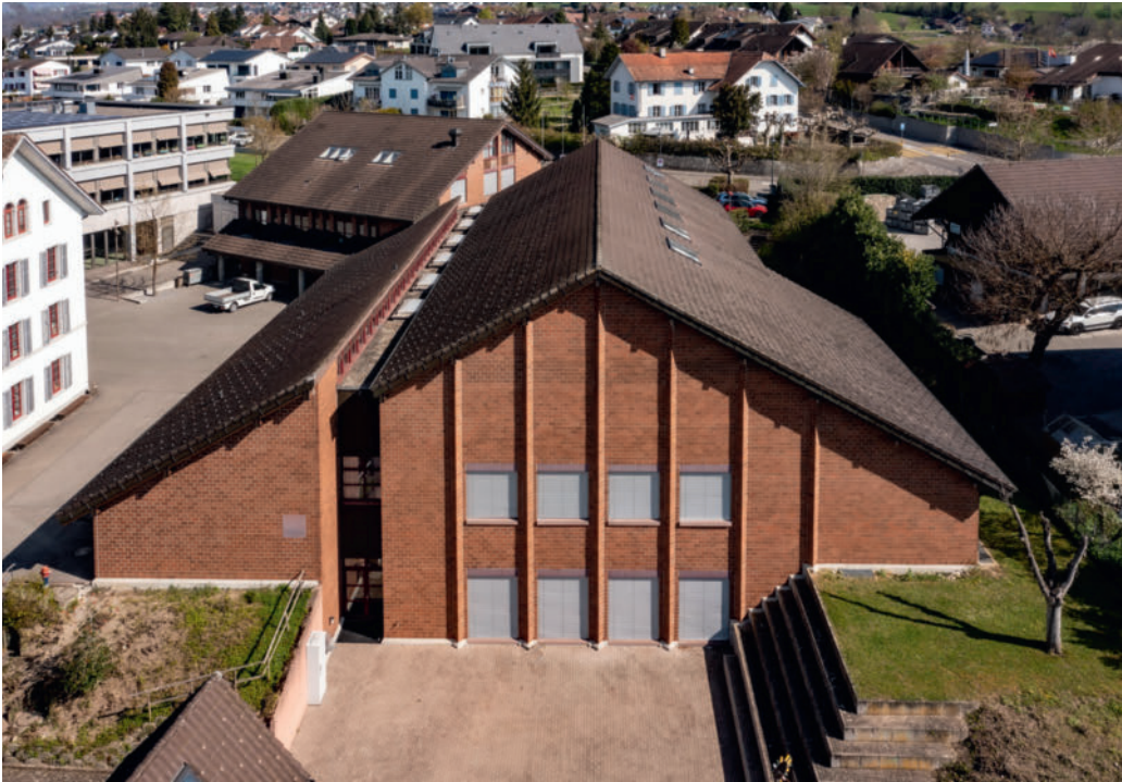
Mehrzweckhalle (vorne) und Gemeindehaus (hinten)

Im Jahr 2025 erarbeitete die Planungskommission zusammen mit dem Architekten, dem Projektberater und den Fachspezialisten aus den Bereichen Elektro, Haustechnik, Statik und Energie das konkrete Sanierungsprojekt und erstellte eine detaillierte Kostenberechnung für den Baukredit.