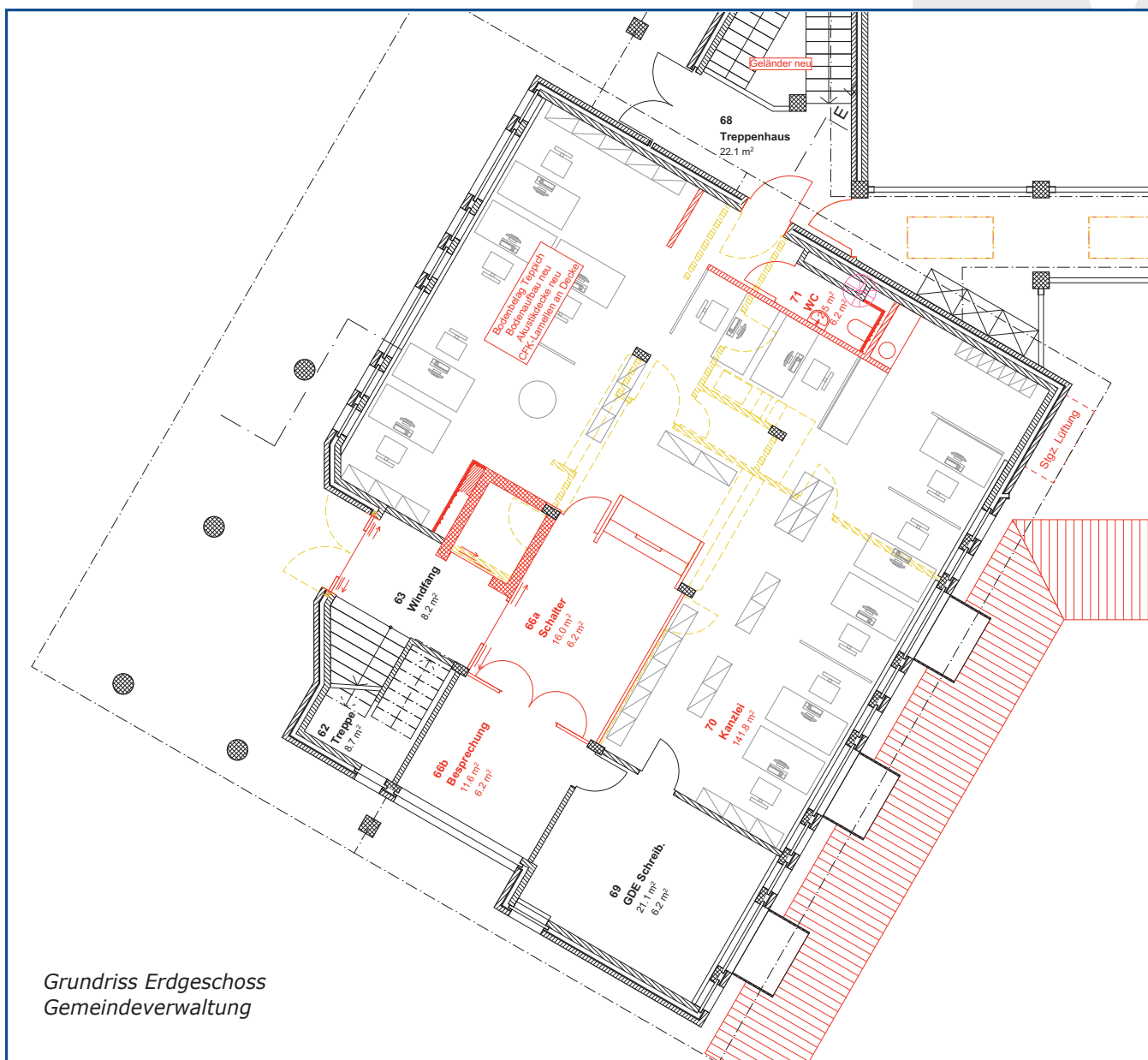
Grundriss Erdgeschoss Gemeindeverwaltung