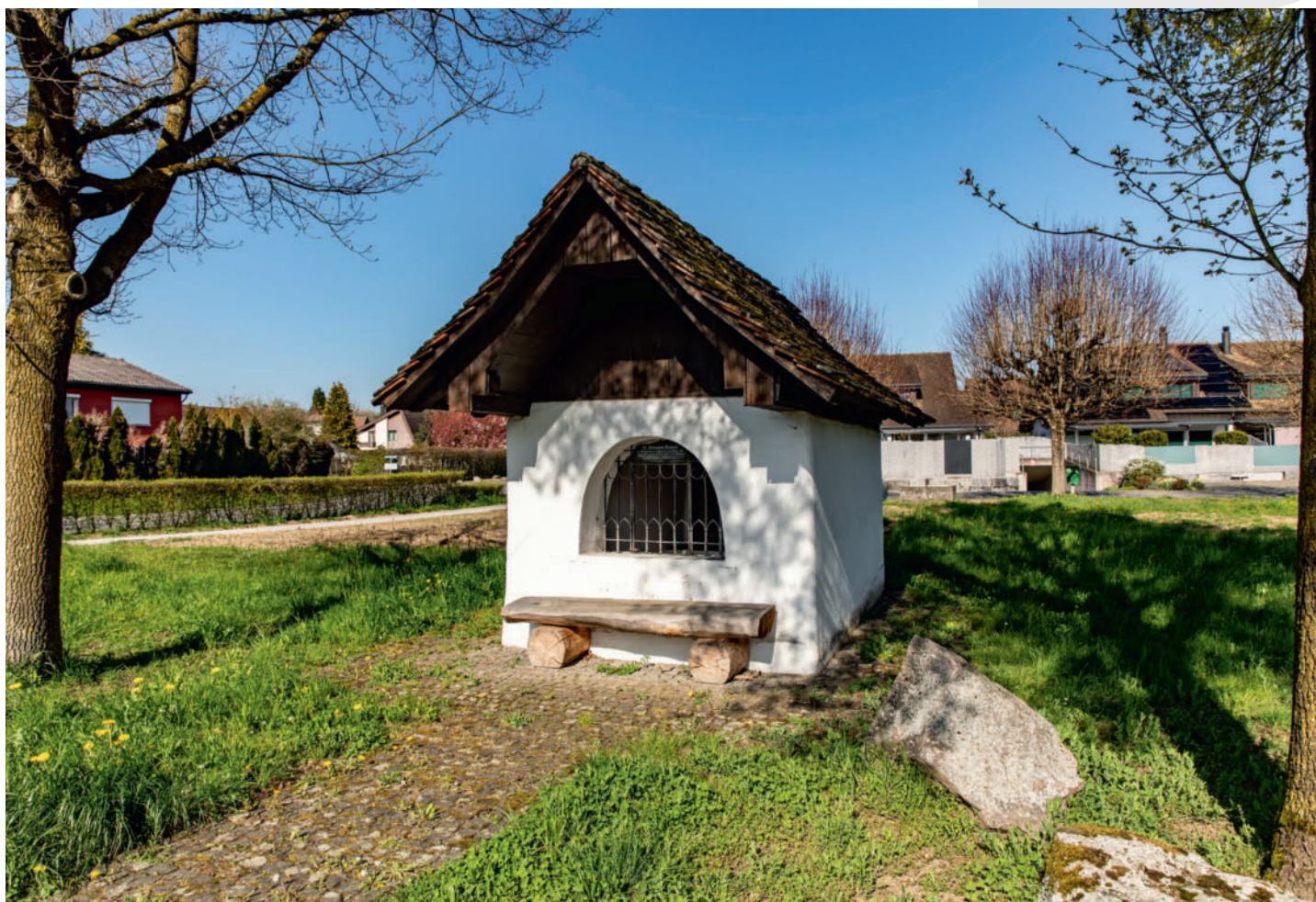
Die St. Nikolaus-Kapelle auf der Chäppeliwiese steht unter kantonalem Denkmalschutz.