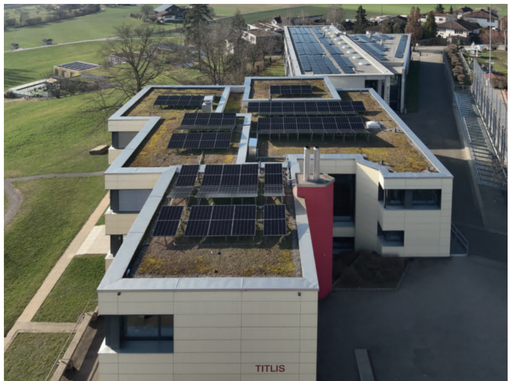
Die neuen Photovoltaikanlagen auf den Schulhäusern Titlis und Pilatus, realisiert im Sommer/Herbst 2025

Der Gemeinderat beantragt, es sei der Rechenschaftsbericht 2025 zu genehmigen.